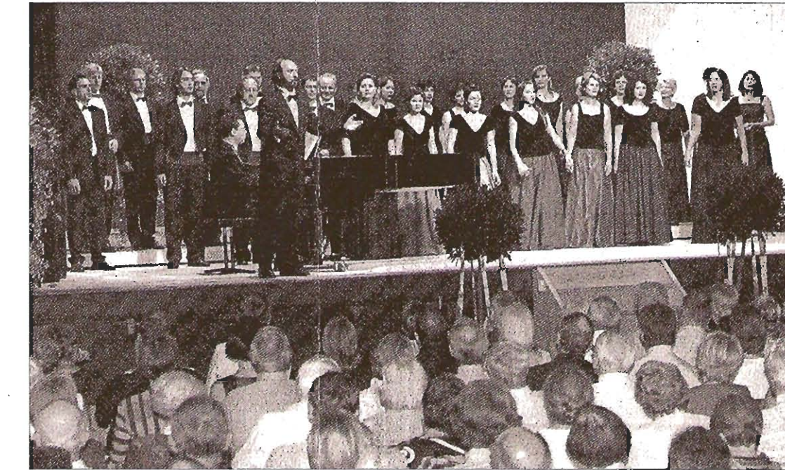
La Compagnia Rossini singt zum Jubiläum der KGU.