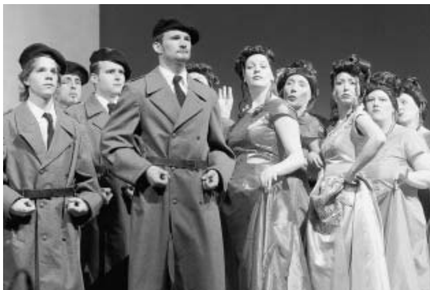
Konzert statt Musicalaufführungen: Der «Evita»-erprobte Chor wagt sich an Auszüge aus der «West Side Story».

Um die Stimmung der wohlbekanntesten Bernstein-Songs auch optisch umzusetzen, haben die beiden Chorleiter sowie ihre Sängerinnen und Sänger mit Ingo Anders zusammengearbei-